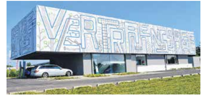
In Ihrer Nähe und rasch vor Ort: SYSCO ist Ihr IT-Partner aus der Region.

SYSCO – EDV ist Vertrauenssache aus Schwertberg ist führender EDV-Komplettanbieter in der Region. Als IT-Center mit rund 50 Mitarbeiter und Mitarbeiterinnen und 34 Jahren Branchenerfahrung ist SYSCO starker und kompetenter Partner für Unternehmen in allen Belangen der EDV.