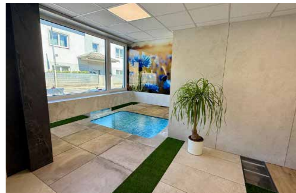
Der neue ansprechende Schauraum im Indoorpool